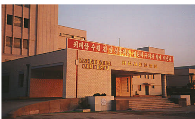
Kreiskrankenhaus Rason Nord-Korea